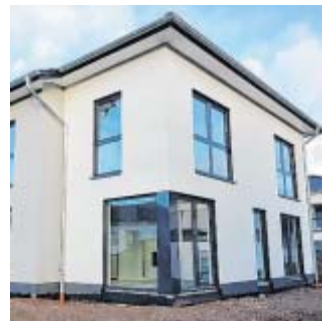
Schulgarten 30: Hier besticht die perfekte Süd-/Westausrichtung dieser attraktiven Stadtvilla.