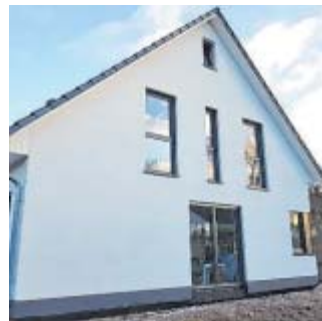
Schulgarten 18: Bodentiefe Fenster sorgen im Dachgeschoss für eine helle Atmosphäre.